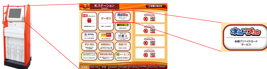
店内「Kステーション」